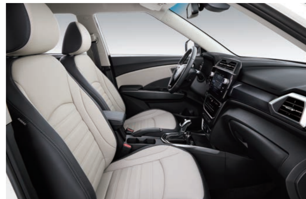
Тканевая обивка сидений