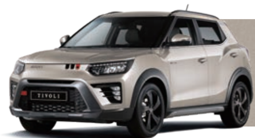
ПЕСОЧНЫЙ БЕЖЕВЫЙ (EBL)