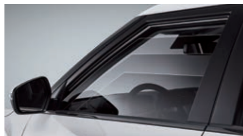
Электрический стеклоподъемник двери водителя с функцией защиты от защемления