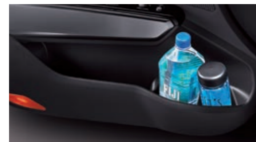
Вместительные карманы в дверях