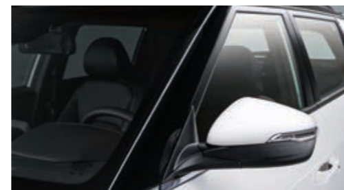
Декоративные наклейки на передние стойки кузова черного цвета (глянцевые)