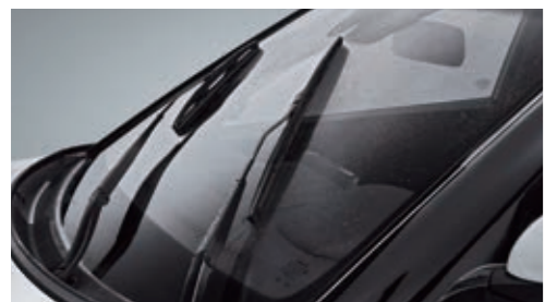
Аэродинамические щетки очистителя ветрового стекла