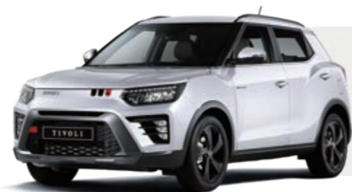
КЛАССИЧЕСКИЙ БЕЛЫЙ (WAA)