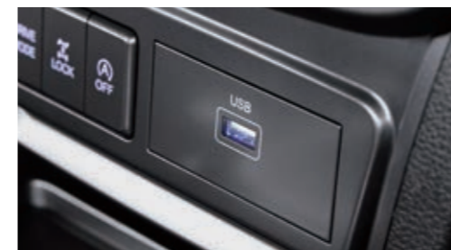
Слот для USB-накопителя