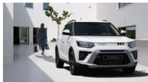
Функция автоматического закрытия