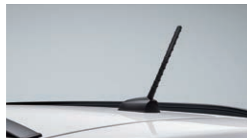
Антенна на крыше