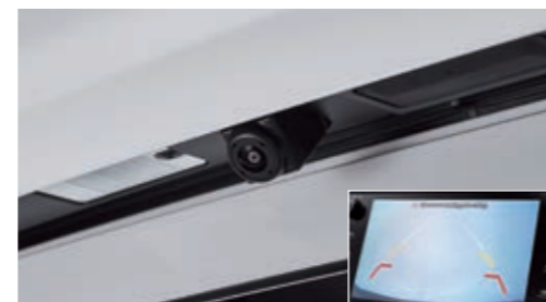
Камера заднего вида