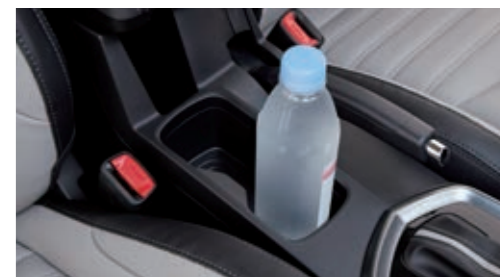
Центральная консоль с двумя подстаканниками