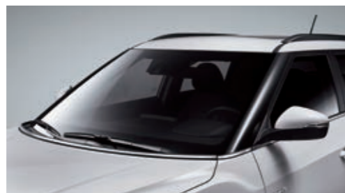
Хромированные молдинги поясной линии и капота