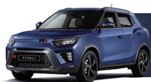
ОКЕАНИЧЕСКИЙ СИНИЙ (BAS)