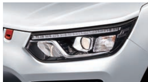
Проекционные фары с корректором света