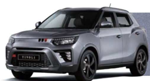
МЕТАЛЛИЧЕСКИЙ СЕРЫЙ (ADE)