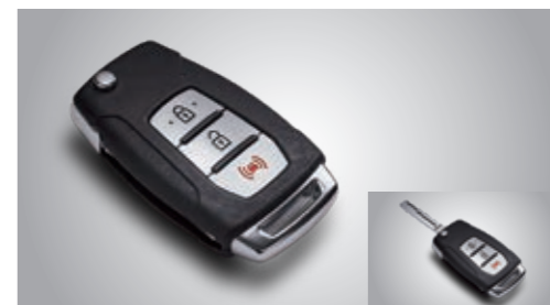
Два складных смарт-ключа