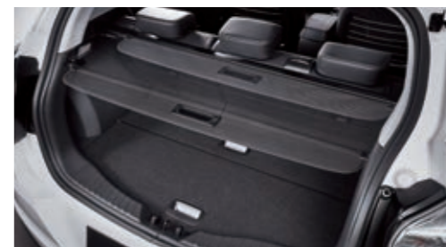
Мягкая шторка для багажного отделения