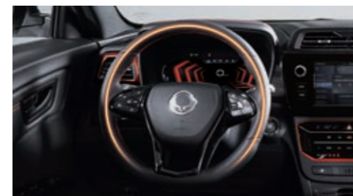
Подогрев рулевого колеса