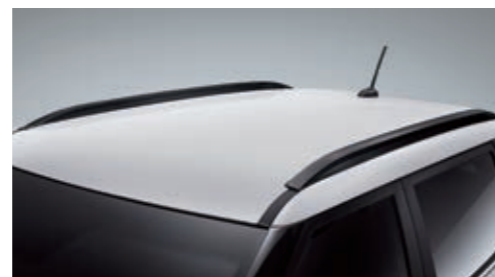
Декоративные рейлинги на крышу черного цвета