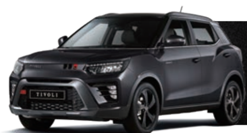
КЛАССИЧЕСКИЙ ЧЁРНЫЙ (LAK)