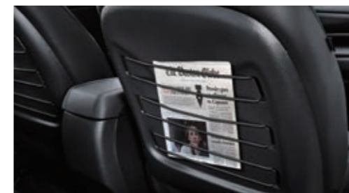
Держатель для журналов из эластичного шнура на спинках передних сидений