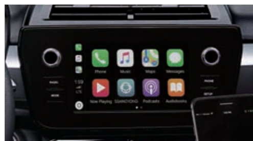
8-дюймовый дисплей мультимедийной системы и двухзонный климат контроль