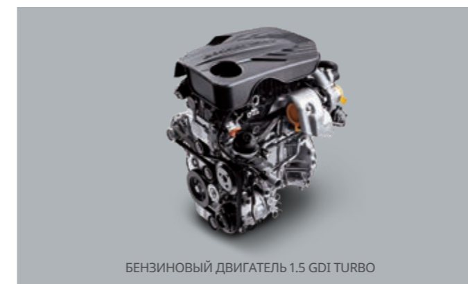
БЕНЗИНОВЫЙ ДВИГАТЕЛЬ 1.5 GDI TURBO