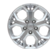
16" легкосплавные колесные диски